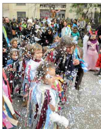
■ Défilés, animations et concert au programme. J.-M.M.

Si l'incertitude plane autour de celui des gueux (lire ci-dessus), au moins deux autres carnivals animeront, eux, les quartiers ce mardi. Du côté des Grisettes , organisé par le Mas des possibles, un EVS (espace de vie sociale) piloté par Adages, le centre de loisirs Ufolep 34, la résidence senior le Pré fleuri, l'Ehpad Les couleurs du temps, avec le partenariat du comité de quartier, le défilé avec petits et grands partira de l'école Beethoven, à 14 h, pour une déambulation festive et colorée. Il va sans dire que Monsieur Carnaval apportera un petit vent de folie dans le quartier ! Au Millénaire , place au carnaval tzigane. Venez le fêter dans une ambiance feutrée et musicale autour des braseros et des parasols chauffants. Au sein de la maison pour tous Mélina-Mercouri (842, rue de la